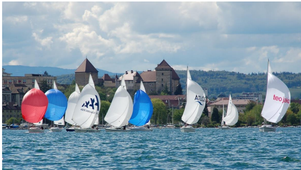
Avec l'autorisation d'A Dos Santos